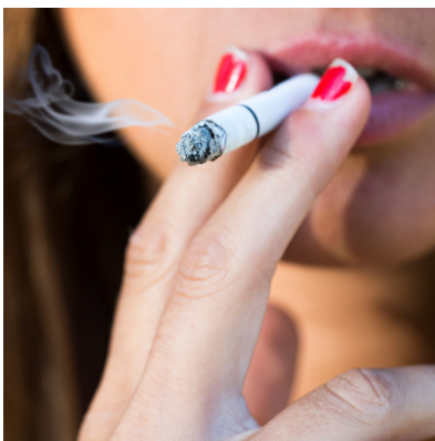
บุหรี่...!แฟชั่นร้ายทำลายเสน่ห์

มาตรการในการรณรงค์เพื่อการไม่สูบบุหรี่ นอกจากการรณรงค์ให้ผู้ชายไทยสูบบุหรี่น้อยลงแล้ว ควรที่จะมุ่งในการรณรงค์ไม่ให้ผู้หญิงไทยสูบบุหรี่เพิ่มขึ้นไปพร้อมๆ กันด้วย และหากทำได้สำเร็จก็จะช่วยลดอัตราการเสียชีวิต อันเนื่องมาจากการสูบบุหรี่ของผู้หญิงไทยได้ปีละเป็นหมื่นคนในอนาคต สังคมไทยจึงควรช่วยกันป้องกันหญิงไทย โดยเฉพาะวัยรุ่นหญิงไม่ให้ตกเป็นทาสของการเสพติดบุหรี่ โดยการรณรงค์ให้สังคมไทยมีความตื่นตัวและร่วมกันสร้างค่านิยมให้ผู้หญิงไทยไม่สูบบุหรี่